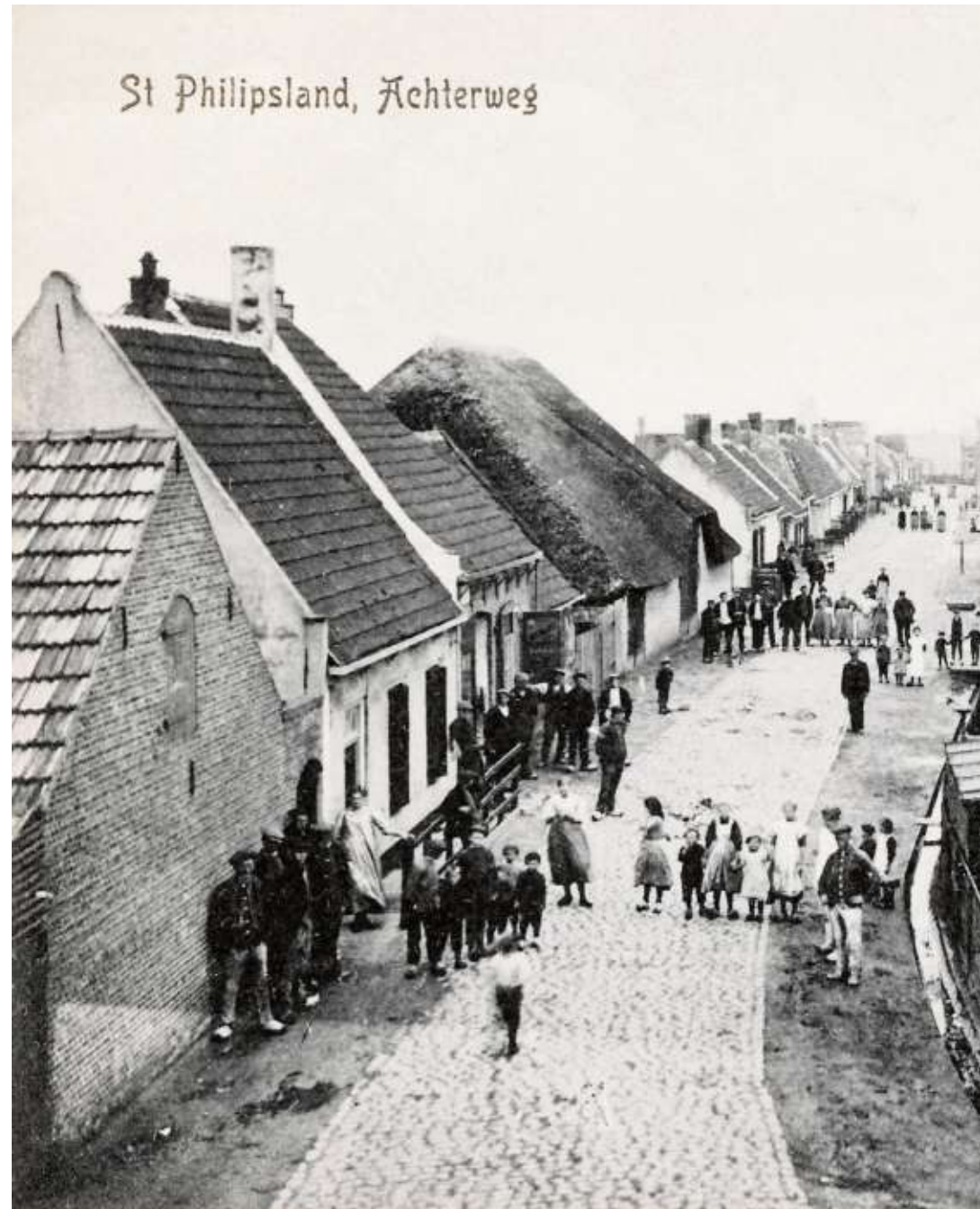
Sint Philipsland rond 1890. De kerk, daterend uit 1871, bevindt zich op dezelfde plaats als die waarin Pieter van Dijke in 1844 werd bevestigd tot predikant.

Ds. Ledeboer schreef een vergadering uit om dat allemaal te regelen en tegelijk de Zeeuwse noodkerk te constitueren en te organiseren. Hij had in Zeeland alleen wat hulpdiensten gedaan en was nog niet officieel aan de gemeenten verbonden. Dat ging nu allemaal veranderen. En Van Dijke gaf begin februari zijn vrijheid terug, hoewel dat na de wetgeving van 1848 een symbolisch gebaar was; maar het voelde als een bevrijding. Een