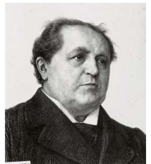
Synodevoorzitter A. Kuyper.

spreken en belang stellen in den strijd en de blijdschap der kerk op aarde, vertel dan uwe oude medestrijders wat gij hier hebt aanschouwd, en hun vreugde zal groot zijn als gij hun toeroept: Ze zijn één!"