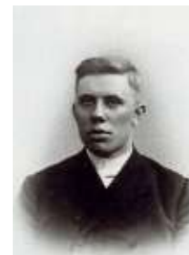
Ds. Kersten. beeld J.M. Vermeulen