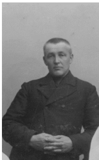
1 Remijn was illegaal binnengesmokkeld

Het is opmerkelijk dat Bel weinig of geen kritiek op de vereniging heeft. Hij had bijvoorbeeld kunnen noemen dat de woorden 'accord van kerkelijke gemeenschap' fout zijn en afkomstig van de beruchte Kuyper,